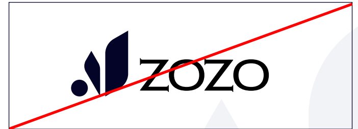
Thay đổi kiểu chữ của logo