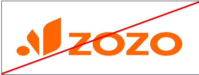
Co kéo logo