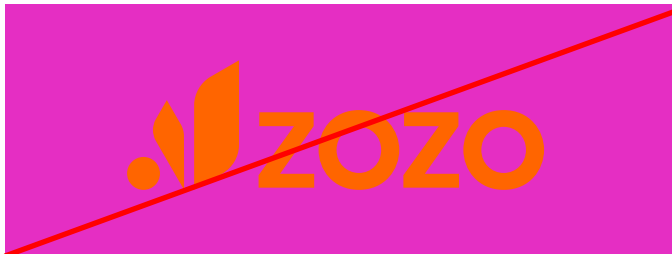
Dùng nền kém tương phản