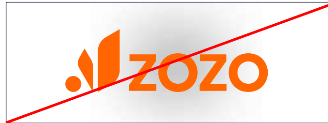
Sử dụng các hiệu ứng đặc biệt