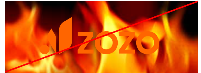
Dùng nền phức tạp